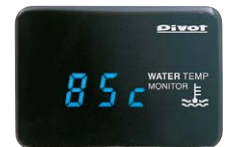
WTM-L (青表示) ¥15,540 (税込) (本体 ¥14,800)

本製品は故障診断コネクタに簡単にカプラーオンするだけで水温表示し、下記のような様々なクルマの状態をチェックできます。 ① 温度上昇によるパワーダウンと燃費悪化 ② オーバーヒート防止 ③ 不要暖機による無駄な燃料消費