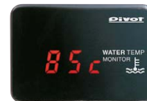
WTM-R (赤表示) ¥13,440 (税込) (本体 ¥12,800)

No need for wiring Coupler connection to the diagnostic monitoring connector for easy-installation.